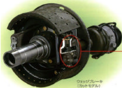
ウェッジブレーキ [カットモデル]

エアの圧力により ウェッジがプランジャーを矢印の方向へ押し、ブレーキシューを押し広げブレーキを掛ける機構です。 従来の、フルエアおよびエアオーバー車と比較し、応答性がすぐれ、制動力の立ち上がりが素早く良好な制動フィーリングが得られます。